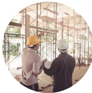
建設現場の 防犯や安全監視に！