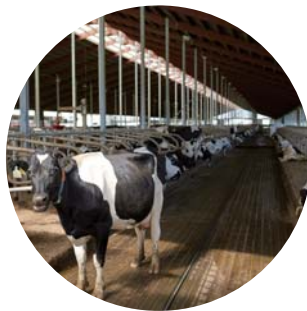
農作物や害獣の 監視に！