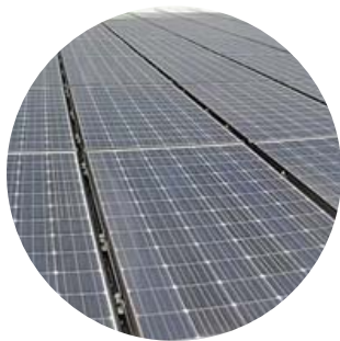
太陽光発電設備の 監視に！

現地に設置したカメラより、映像データをネットワーク環境を通じてサーバに収集・保存します。